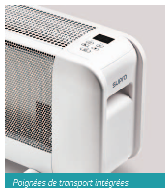
Poignées de transport intégrées