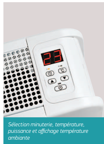
Sélection minuterie, température, puissance et affichage température ambiante