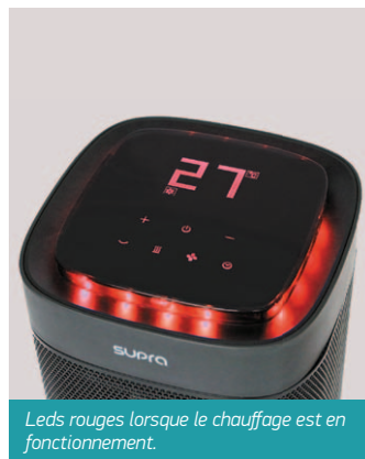
Leds rouges lorsque le chauffage est en fonctionnement.