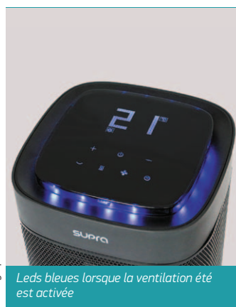
Leds bleues lorsque la ventilation été est activée