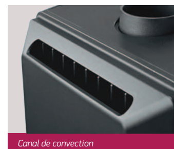
Canal de convection